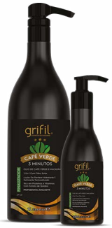
4. LOÇÃO FINALIZADORA ÓLEO DE CAFÉ E MACADÂMIA 300mL e 1L

MODO DE USAR: 1) SHAMPOO - pH 5,0. Aplique o Shampoo Óleo de Café Verde e Macadâmia nos cabelos molhados massageando com as pontas dos dedos até a formação de espuma abundante. Enxágue em seguida. Se necessário repita a operação. 2) CONDICIONADOR - pH 4,0. Após lavar os cabelos com o Shampoo Óleo de Café Verde e Macadâmia, retire o excesso de água dos fios e distribua quantidade suficiente do Condicionador por todo o comprimento. Enxágue com água em abundância. 3) MÁSCARA HIDRATANTE pH 4,0. Após lavar os cabelos com o Shampoo Óleo de Café Verde e Macadâmia retire o excesso de água dos fios e distribua quantidade suficiente da Máscara Hidratante mecha por mecha, massageando do comprimento às pontas, de cima para baixo. Deixe agir por 3 minutos. Enxágue abundantemente. 4) LOÇÃO FINALIZADORA - pH 4,0. MODO DE USAR: Após aplicar o Shampoo e Máscara Óleo de Café Verde Grifil, aplique a Loção Finalizadora Óleo de Café Verde nos cabelos úmidos, massageie bem e deixe agir, trazendo uma finalização perfeita. Não é necessário enxaguar.