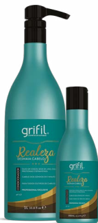
2. CONDICIONADOR REALEZA ÓLEO DE COCO 300mL e 1L