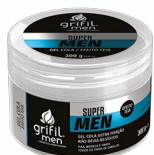
5. GEL COLA ULTRA FIXAÇÃO 300g

MODO DE USAR: 1) REPARADOR DE PONTAS - Composto por silicones. Elimina as pontas quebradiças e ressecadas, dando suavidade e brilho especial aos cabelos. Após lavar os cabelos aplique pequenas quantidades sobre os cabelos secos, principalmente nas pontas. Não enxaguar. 2) BRILHO FINALIZADOR - O Brilho Capilar Grifil, proporciona um lindo penteado, dando aos cabelos um acabamento especial. Aplicar no comprimento dos fios capilares para finalizar o penteado. 3) POMADA MODELADORA ULTRA BRILHO - Espalhar uma pequena quantidade nas mãos e aplicar nos cabelos secos ou levemente umedecidos. EFEITO MOLHADO. 4) POMADA MODELADORA EFEITO TEIA - Espalhar uma pequena quantidade nas mãos e aplicar nos cabelos secos ou levemente umedecidos. EFEITO SECO. 5) GEL COLA ULTRA FIXAÇÃO - Aplique sobre os cabelos limpos e levemente úmidos. Modele de acordo com o penteado desejado.