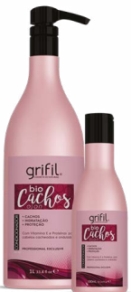
2. CONDICIONADOR BIO CACHOS 300mL e 1L