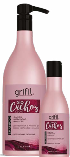
1. SHAMPOO BIO CACHOS 300mL e 1L