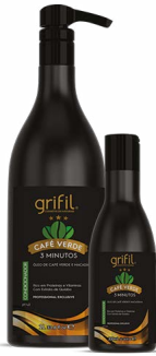
2. CONDICIONADOR ÓLEO DE CAFÉ E MACADÂMIA 300mL e 1L