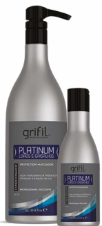
2. CONDICIONADOR PLATINUM 300mL e 1L