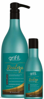
1. SHAMPOO REALEZA ÓLEO DE COCO 300mL e 1L