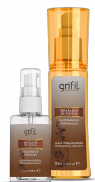
1. REPARADOR DE PONTAS 35mL e 90mL