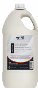
SHAMPOO NEUTRIX PEROLADO - 5L