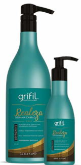
4. LOÇÃO REALEZA ÓLEO DE COCO 300mL e 1L

MODO DE USAR: 1) SHAMPOO - pH 5,0. Aplique o Shampoo Realeza nos cabelos molhados massageando com as pontas dos dedos até a formação de espuma abundante. Enxágue em seguida. 2) CONDICIONADOR - pH 4,0. Após lavar os cabelos com o Shampoo Realeza, retire o excesso de água dos fios e distribua quantidade suficiente do Condicionador por todo o comprimento. Enxágue com água em abundância. 3) HIDRATAÇÃO - pH 4,0. Após lavar os cabelos com o Shampoo Realeza, retire o excesso de água dos fios e distribua quantidade suficiente da Hidratação Realeza, massageando do comprimento às pontas, de cima para baixo. Deixe agir e enxaguar em seguida. 4) LOÇÃO - pH 4,0. Após aplicar o Shampoo e Hidratação Realeza Grifil, aplique a Loção de Pentear nos cabelos úmidos, massageie bem e deixe agir, trazendo uma finalização perfeita. Não é necessário enxaguar.