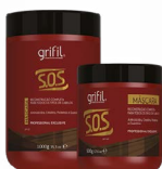
3. MÁSCARA SOS 500g e 1kg