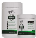
3. MASSA VEGETAL HERBAL 500g e 1kg