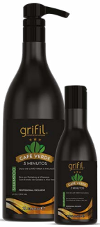
1. SHAMPOO ÓLEO DE CAFÉ E MACADÂMIA 300mL e 1L