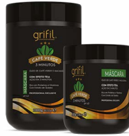
3. MÁSCARA HIDRATANTE ÓLEO DE CAFÉ E MACADÂMIA 500g e 1kg