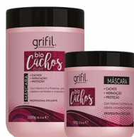
3. MÁSCARA HIDRATANTE BIO CACHOS 500g e 1kg