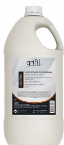
CONDICIONADOR NEUTRIX PEROLADO - 5L

O Shampoo Neutro Perolado Grifil possui uma formulação leve e equilibrada que permite o uso diário, restaurando os fios e devolvendo brilho e vida aos cabelos.