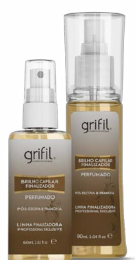
2. BRILHO FINALIZADOR 60mL e 90mL