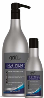
1. SHAMPOO PLATINUM 300mL e 1L