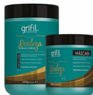
3. HIDRATAÇÃO REALEZA ÓLEO DE COCO 500g e 1kg