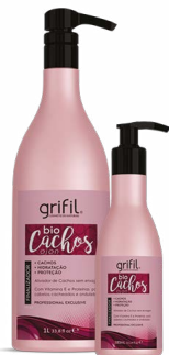
4. ATIVADOR BIO CACHOS 300mL e 1L

MODO DE USAR: 1) SHAMPOO - pH 5,0. Aplique o Shampoo Bio Cachos nos cabelos molhados massageando com as pontas dos dedos até a formação de espuma abundante. Enxágue em seguida. Se necessário, repita a operação. 2) CONDICIONADOR - pH 4,0. Após lavar os cabelos com o Shampoo Bio Cachos, retire o excesso de água dos fios e distribua quantidade suficiente do Condicionador Bio Cachos por todo o comprimento. Enxágue com água em abundância. 3) MÁSCARA HIDRATANTE - pH 4,0. Após Lavar os cabelos com o Shampoo Bio Cachos retire o excesso de água dos fios e distribua quantidade suficiente da Máscara Hidratante Bio Cachos mecha por mecha, massageando do comprimento às pontas, de cima para baixo. Deixe agir por 10 minutos. Enxágue abundantemente. 4) ATIVADOR - pH 4,0. Após lavar com os cabelos com o Shampoo e Condicionador Bio Cachos, aplique o Ativador Bio Cachos no cabelo úmido ou seco, do comprimento até às pontas. Amasse as mechas com movimentos de baixo para cima modelando seus cachos. Sem enxágue.