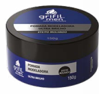
3. POMADA MODELADORA ULTRA BRILHO 150g