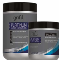
3. MÁSCARA HIDRATANTE PLATINUM 500g e 1kg

MODO DE USAR: 1) SHAMPOO - pH 5,0. Aplicar o Shampoo Platinum sobre os cabelos molhados e massagear bem. Em seguida enxágue e aplique o Condicionador Platinum. 2) CONDICIONADOR - pH 4,0. Aplicar sobre os cabelos úmidos. Massagear levemente e deixar agir por alguns minutos. Enxaguar em seguida. 3) MÁSCARA HIDRATANTE - pH 4,0. Aplicar sobre os cabelos úmidos, mecha a mecha, deixar agir o tempo necessário para matização. Deve-se tomar o cuidado para não chumbar o cabelo.